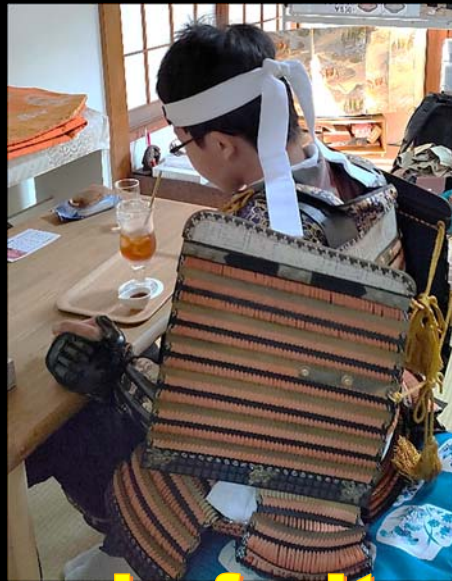
jus de fruit