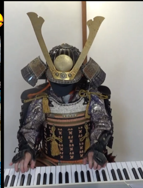
Jouons, keyboard, Koto